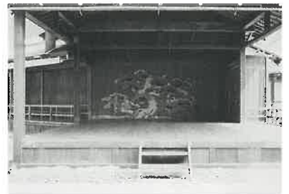
江戸時代後期、築庭を命じた藩主・池田綱政は、能に熱心ですぐれた舞い手でもありました。昭和 20 年の空襲で能舞台も焼失したため、現在の舞台は綱政の子・継政時代の遺構をもとに復元。鏡板の老松と右板壁の竹の絵は、郷土の画家・池田遙邨画伯の筆によるものです。

天から鼓が降る夢を見た王伯王母という夫婦のもとに生まれた子・天鼓は、本当に天から鼓を授かり、その妙音が巷で評判となる。噂を聞いた帝は鼓を宮中に差し出せと命じるが、天鼓は鼓とともに逃亡し、捕らえられ呂水に沈められる。ところが宮中に持ち帰った鼓は音が鳴らない。そこで、父・王伯を呼び出して打たせると鼓は音を発する。心打たれた帝が天鼓を叩く管弦講を催すと天鼓の亡霊が現れ、弔いに感謝して鼓を打ち舞い戯れる。