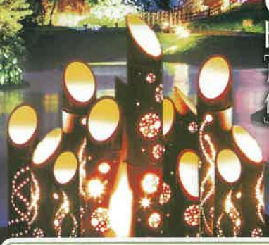
※写真は合成イメージです。